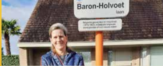
Stratenaamborden eindelijk vernieuwd (p.2)