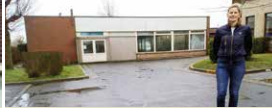
Zwembad Dadizele verkocht (p.3)